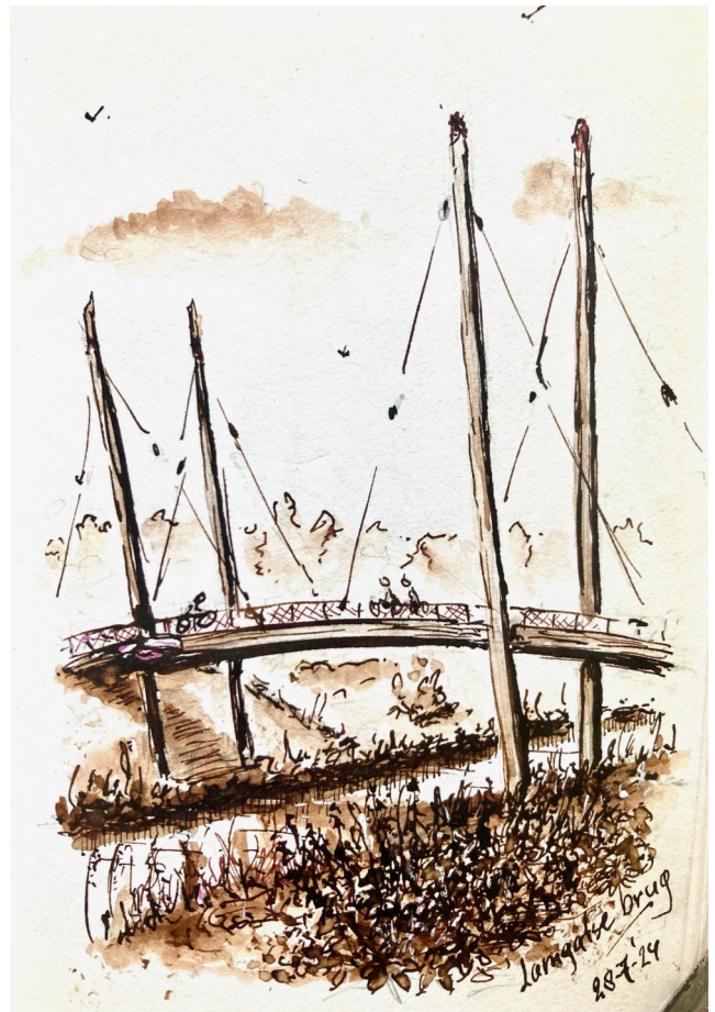
Tekening Piet Bruijns