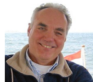
Wouter van Straten

Na de vakantie zijn de werkzaamheden weer begonnen. Zoals u op onderstaande foto's ziet, moeten er veel leidingen in de grond gelegd worden en weer afgedekt voordat er werkelijk gebouwd kan gaan worden. Fotograaf Wouter van Straten (deze fotograaf heeft toestemming de bouwwerkzaamheden te fotograferen) maakt de foto's. Vanaf nu krijgen we de door hem gemaakte foto's toegestuurd, zodat we jullie maandelijks de voortgang kunnen laten zien.