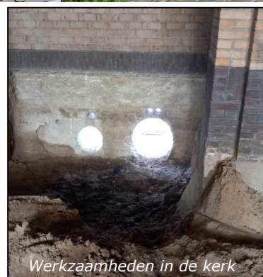
Werkzaamheden in de kerk