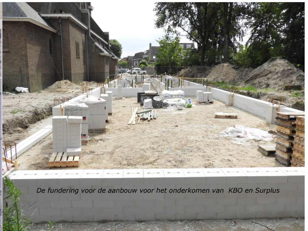
De fundering voor de aanbouw voor het onderkomen van KBO en Surplus