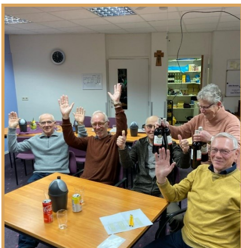
Het winnend team

Wellicht komt er volgende winter een vierde quiz.