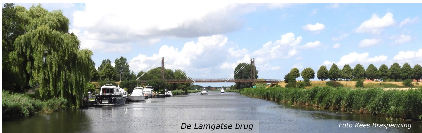
De Lamgatse brug