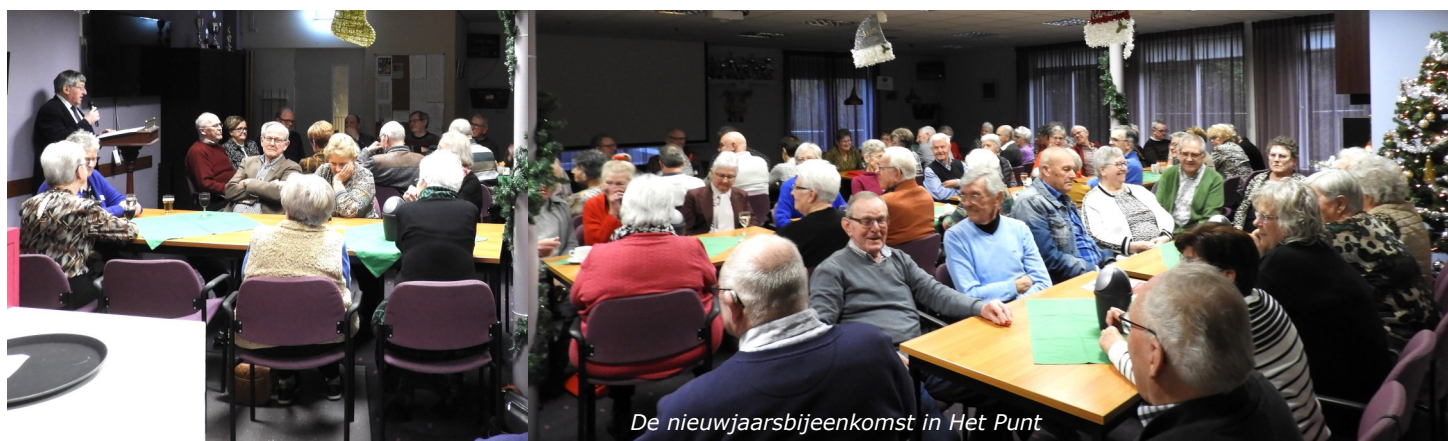
De nieuwjaarsbijeenkomst in Het Punt