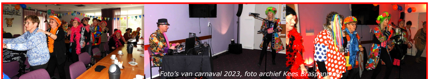
Foto's van carnaval 2023